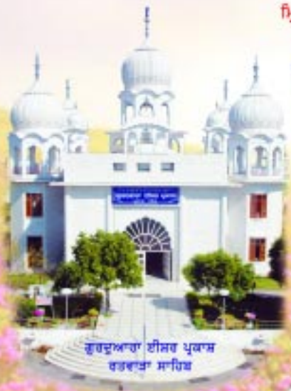
ਗੁਰਦੁਆਰਾ ਈਸਰ ਪ੍ਰਕਾਸ਼ ਰਤਵਾੜਾ ਸਾਹਿਬ

ਪਰ ਇਸ ਨੂੰ ਕੋਈ ਵੀ ਮ੍ਰਿਤ ਮੰਡਲ ਨਹੀਂ ਕਹਿਣਾ ਚਾਹੁੰਦਾ ਕਿਉਂਕਿ ਇਸ ਤਰ੍ਹਾਂ ਦੀ ਭਾਵਨਾ ਦਾ ਸੰਬੰਧਨ ਇਸ ਦੀਆਂ ਮਨ ਦੀਆਂ ਰੁਚੀਆਂ ਤੋਂ ਵਿਪਰੀਤ ਹੋ ਜਾਂਦਾ ਹੈ। ਇਸ ਜੀਵ ਨੇ ਇਸ ਲੋਕ ਨੂੰ ਸਦਾ ਰਹਿਣ ਵਾਲਾ ਸਟੇਸ਼ਨ ਮੰਨਿਆ ਹੋਇਆ ਹੈ - 'ਜੇ ਉਪਜਿਓ ਸੇ ਬਿਨਸਿ ਹੈ.....(ਅੰਗ-੧੪੨੯) ਦੀ ਸੋਝੀ ਕੇਵਲ ਵਿਰਲਿਆਂ ਨੂੰ ਹੈ। ਉਨ੍ਹਾਂ ਨੂੰ ਸਮਰੱਥ ਸਤਿਗੁਰੂ ਨੇ ਗਿਆਨ ਦਾ ਚਾਨਣਾ ਬਖਸ਼ਿਆ ਹੈ ਕਿ 'ਭੇ ਵਿਚਿ ਆਵਹਿ ਜਾਵਹਿ ਪੁਰ ॥' (ਅੰਗ-੪੬੪)